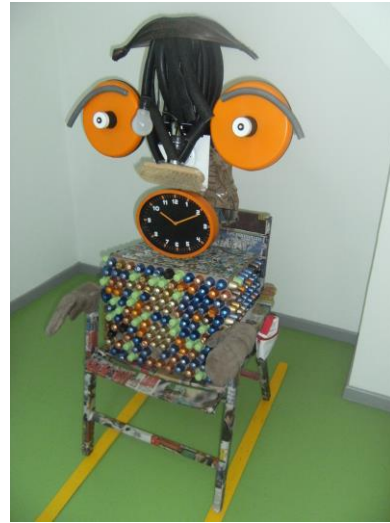
SESSAD du Piémont des Vosges