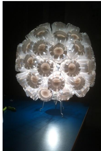
CHRS Cité Relais